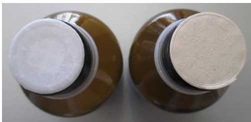
Bild 1: Vergleich nach Öffnung - links: produktkonform mit Siegelfolie, rechts: Defekt, leicht raue, beigefarbene PE-Scheibe haftet oben auf der Siegelfolie

Der Defekt ist daran zu erkennen, dass die PE-Dichteinlage bei der Erstöffnung an der Siegelfolie anhaftet und die dem Deckel zugewandte Seite etwas rau und leicht beige erscheint, der Deckel ist leer (Bild 1 und 2).