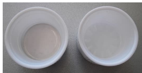
Bild 2: Vergleich der Deckel, Innenseite - links: produktkonform mit Dichteinlage, rechts: Defekt, leerer Deckel

Korrekturmaßnahme (Vgl. nachfolgende 5-Schritte-Anleitung):