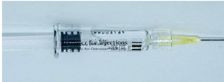
Bild 3. Kolben komplett herausgezogen, Sterilität nicht mehr gegeben

Bild 2. Der Spritzenkolben kann bis zu dieser Position herausgezogen werden.