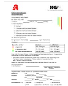
Abbildung 1: „Informationsbogen Blutzucker“