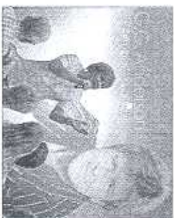
Schlagerstar G.G. Anderson kam gestern zu einem Kurzauftritt in die Galerie Roter Turm und begeisterte seine Fans.